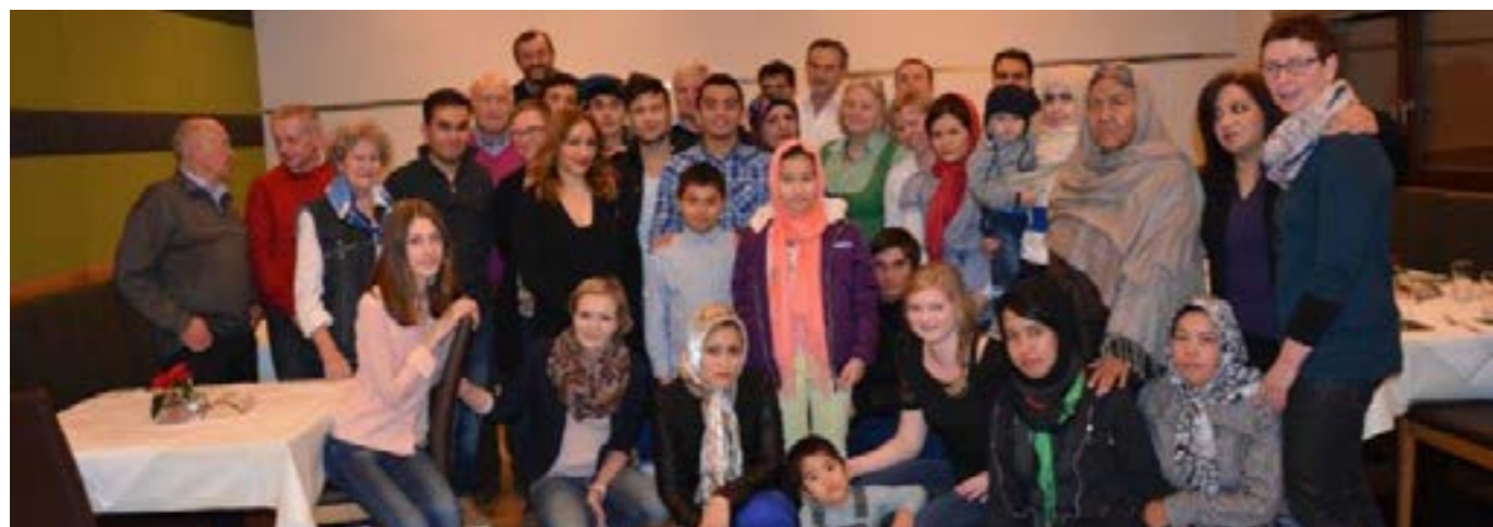
„Beim Reden kommen die Leut zusammen!“

Österreicher sorgten für gemütliche Stimmung und spannende Unterhaltungen mit facettenreichem sprachlichem und kulturellem Hintergrund. Ein großes Danke an alle ehrenamtlich helfenden Hände für diesen gelungenen Abend und die tolle Zusammenarbeit im Integrationsprozess.