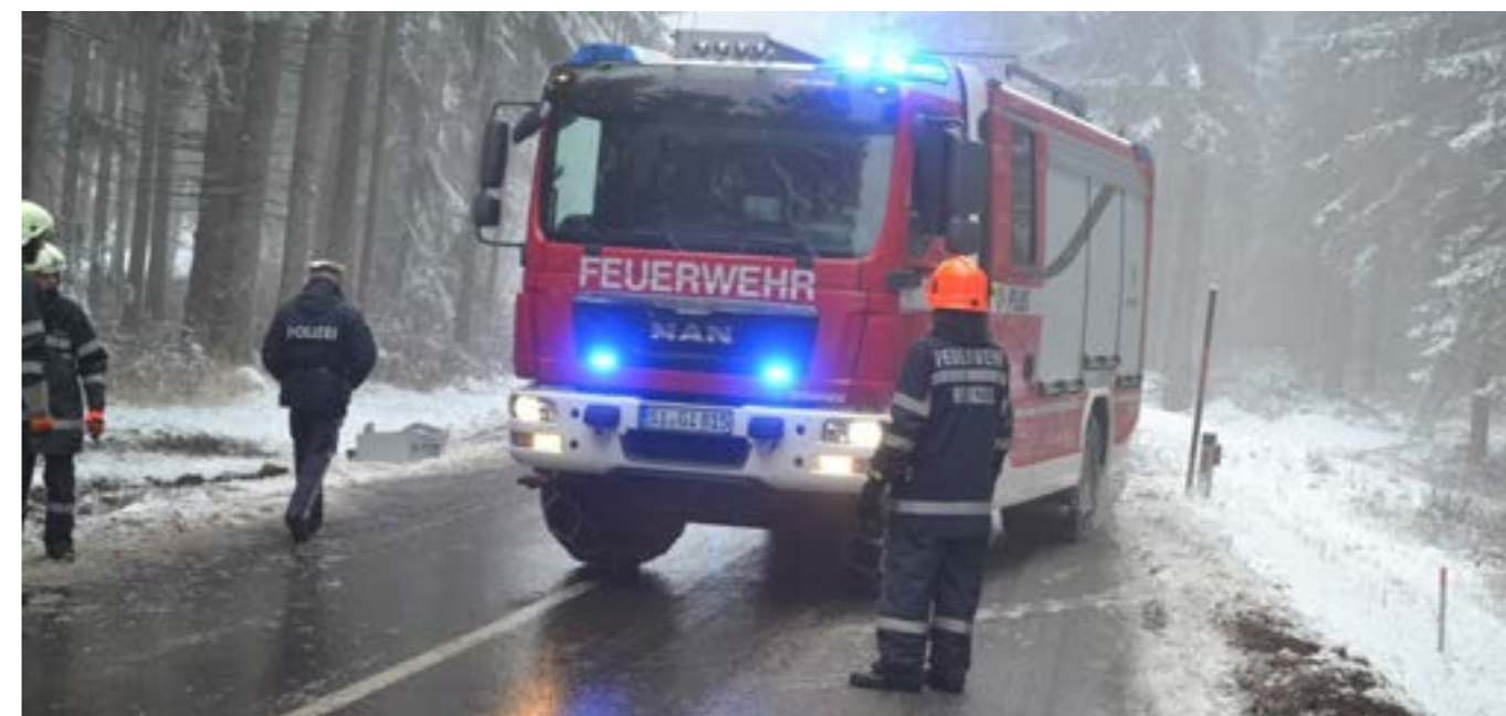
Im Einsatz bis unser neues Einsatzfahrzeug kommt: Leihauto der Firma Gimaex Österreich

erwehr, wohin er am 01. Dezember von 4 Kameraden der FF Wenigzell an die slowenisch-kroatische Grenze überstellt wurde. Beim neuen Besitzer, der Freiwilligen Feuerwehr Kuna, wird unser Tanklöschfahrzeug ebenfalls als Feuerwehrfahrzeug und für den Winterdienst eingesetzt. Zur Überbrückungszeit, bis unser neues Fahrzeug geliefert wird, stellt uns die Fa. Gimaex ein Leitfahrzeug zur Verfügung. Mit großer Zuversicht schauen wir dem März entgegen, da wir in diesem Monat nach mehreren Monaten Lieferverzug unser neues Einsatzfahrzeug bei der Firma Gimaex abholen können.