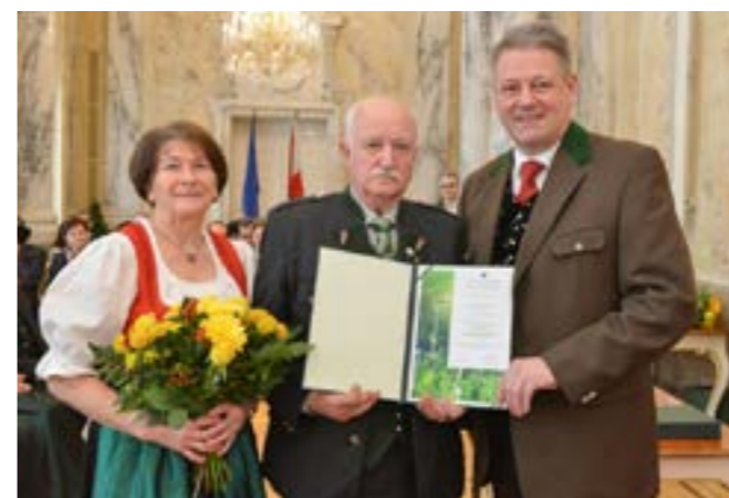
Verleihung des Ökonomierates durch Bundesminister Andrä Rupprechter

Viele fleißige Hände sind notwendig, um die Weihnachtspakete zusammenzustellen und zu verteilen.