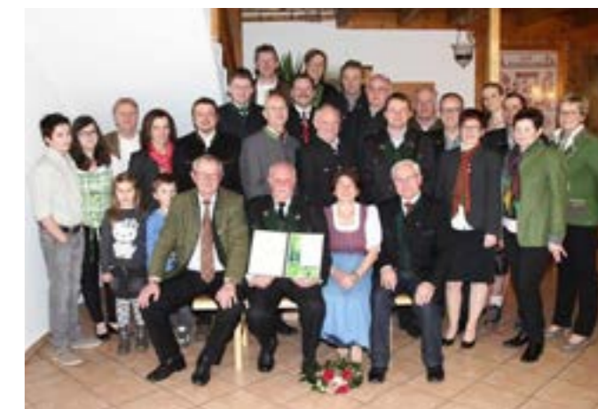
Feierlichkeit im familiären Rahmen