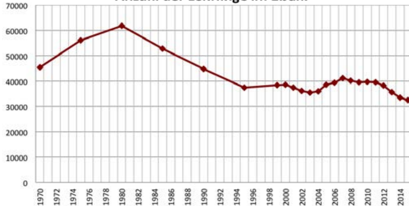
Anzahl der Lehrlinge im 1. Jahr

Große Unterschiede gibt es bei den Einstiegsgehältern. An letzter Stelle im Ranking der Einstiegsgehälter befindet sich beispielsweise der/die ausgebildete Immobilienkaufmann/frau (durchschnittlicher Brutto-Monatslohn von € 1.210-1.360). Die Spitzenreiter mit dem höchsten Lohnniveau hingegen sind ausgelernte Dachdecker (€ 2.180-2.400), Maurer (€ 2.190-2.430) oder Medienfachleute (€ 2.120-2.350). Genauere Informationen zu den Gehältern der einzelnen Berufsgruppen enthält der Gehaltskompass des AMS ( http://www.gehaltskompass.at/berufsliste ).